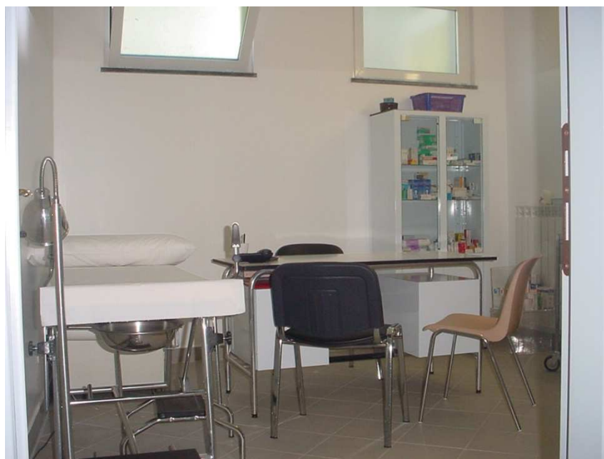
Uno degli altri ambulatori

Tutti i professionisti sono dotati di cartellino di riconoscimento.